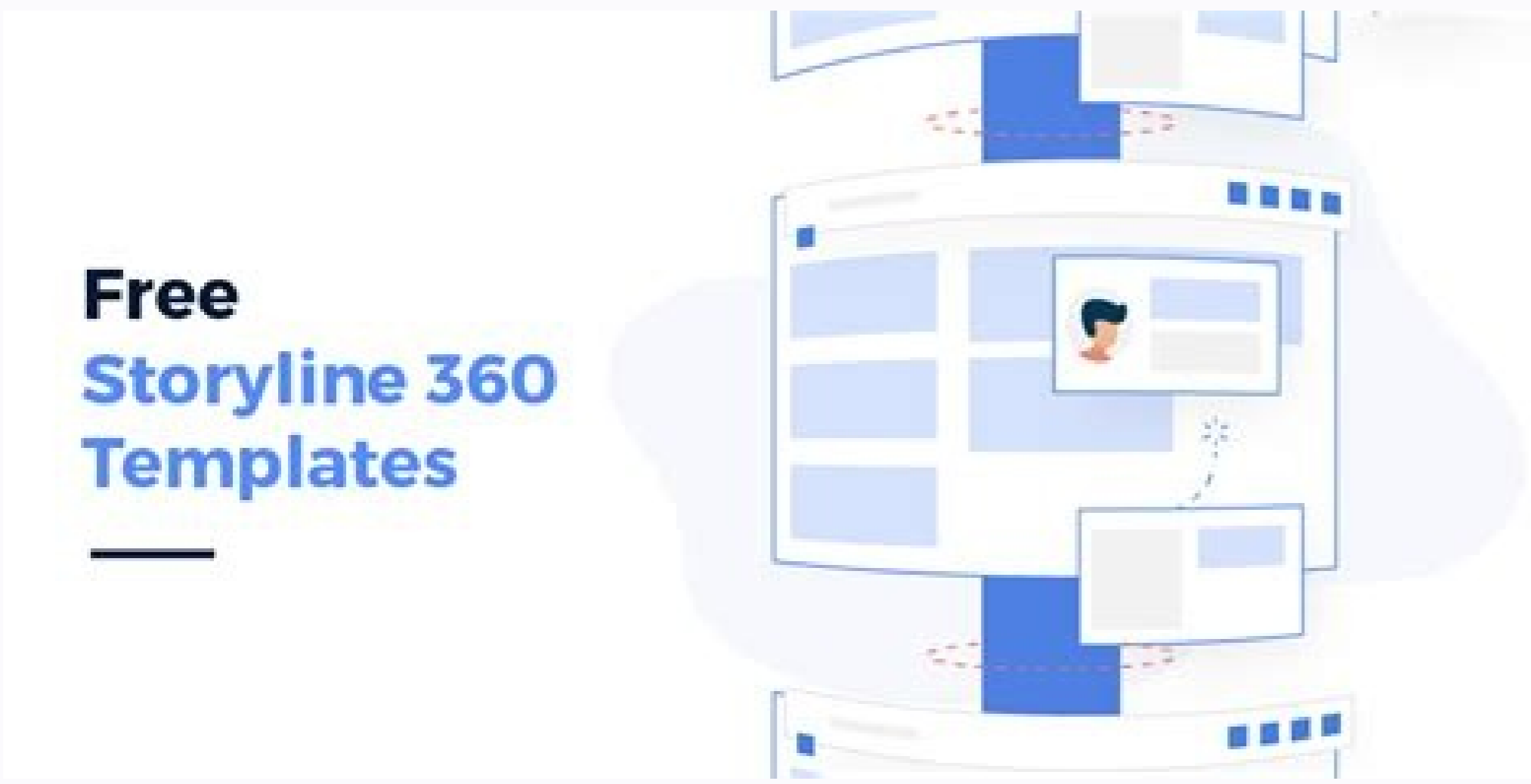
Articulate storyline 360 templates free.